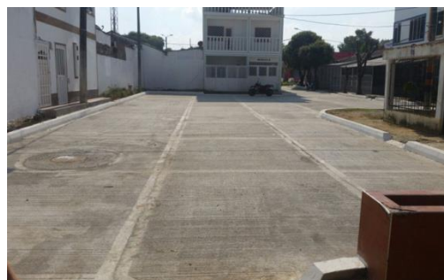
PINOS , Calle 34 entre carreras 38 y 40