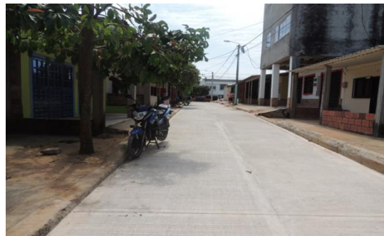
NUEVO HORIZONTE , Carrera 57T con calle 47 al fondo