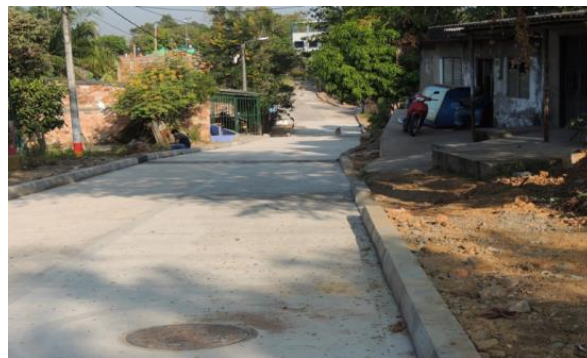
NUEVE DE ABRIL , Calle 48 entre carrera 57 (polideportiva), 58 y 59 (vía principal)