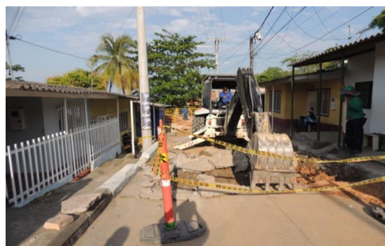
CIUDADELA CINCUENTENARIO, Calle 34 entre carreras 27 y 28 (vía inconclusa)