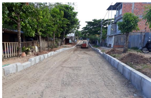
ALTOS DEL CAMPESTRE, Carrera 53 entre calles 39, 40 y 41 (En ejecución)