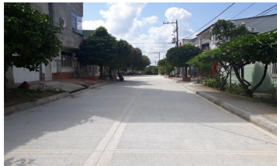
PINOS, Carrera 36 entre calles 34, 33, 32ª al fondo