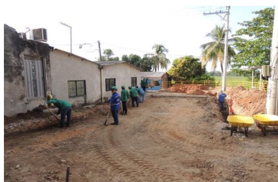
CIUDADELA CINCUENTENARIO, Carrera entre calles 34 y 34A