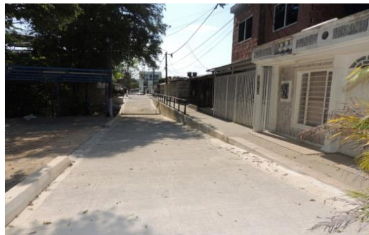
MANDARINOS, Calle 35B con carreras 43 al fondo