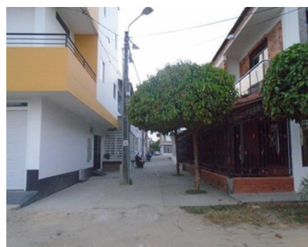
MANDARINOS , Calle 35Bis entre carreras 41, 42 y 43