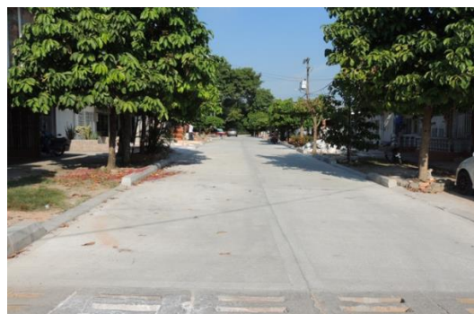
MANDARINOS , Calle 35ª entre carreras 41, 42 y 43