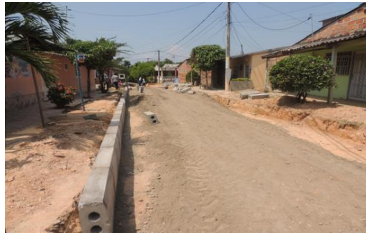
ALTOS DEL CAMPESTRE, Calle 40 entre carrera 54 bajando (En ejecución)