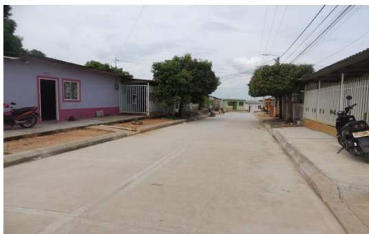
VILLARELYS II, Calle 49ª entre carreras 53 y 54 – Detrás Villa Plata