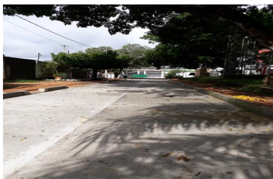
PINOS , Calle 32ª con carrera 36 al fondo (Peatonal – Polideportivo)