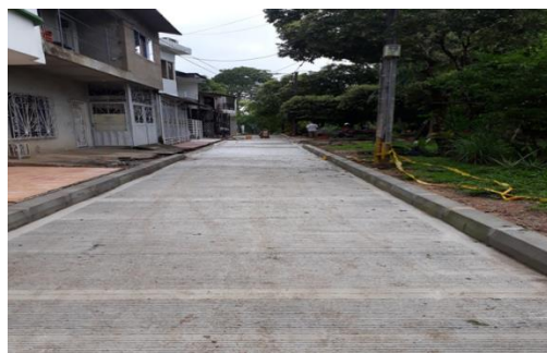
PINOS , Calle 33 con carrera 36 al fondo (Peatonal – Polideportivo)