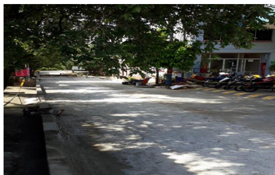
YARIMA, Carrera 36ª entre Diagonal 36ª y Línea Férrea