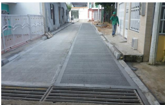
PINOS, Carrera 37 con calles 34 al fondo