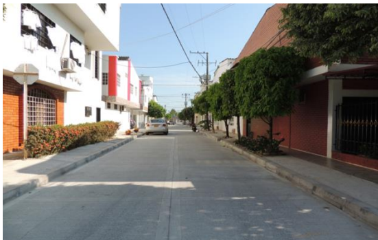
MANDARINOS , Carrera 42 entre calles 35, 35 Bis, 35ª y 35B