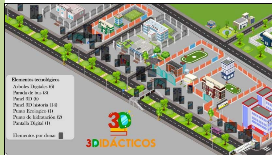
Imágenes en render y 3D de corredor Digital