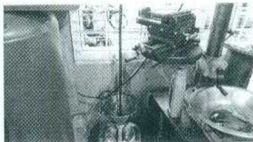
Almacenamiento temporal de los aceites y lubricantes usados