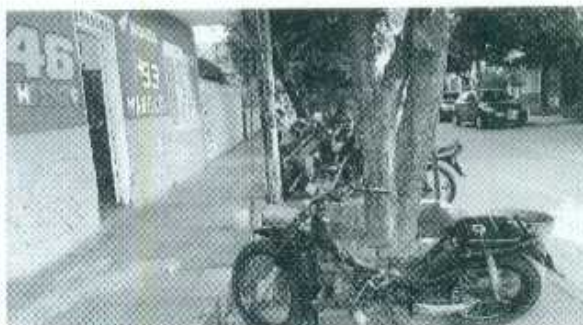
Uso del espacio para parqueo de motocicletas