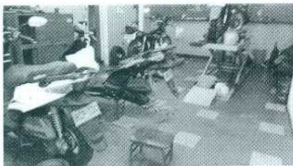
Interior del taller