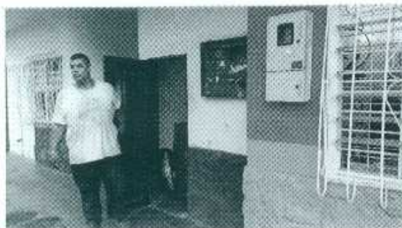
Cuarto o lugar destinado a realizar las labores de pintura