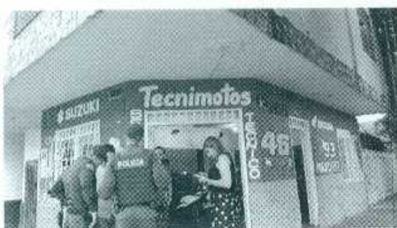
Establecimiento Taller de motos - carrera 16 con avenida 52 esquina Barrio Colombia